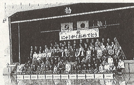
【入学式 集合写真撮影の様子】

今週末28日(金)には、1年生を迎える会・春の遠足を行います。本庄公園まで少し長い距離を歩くこととなりますが、その行程や現地での遊びを通して、子どもたち同士の絆がさらに深まることと思います。遠足当日、天気にも恵まれることを、勸興小のみんなで願っているところです。