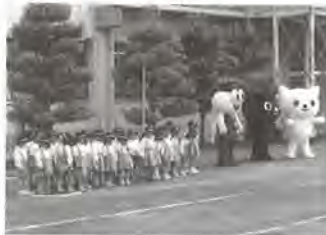
ながら防犯出發式