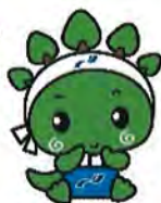
学校法人永原学園 公式マスコットキャラクター "ナガール"