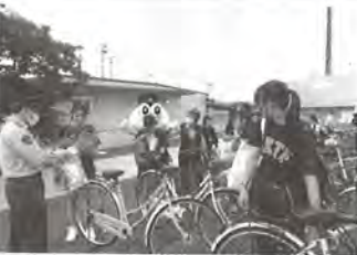
佐大キャンパスにて 久保田駅にて