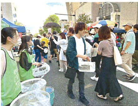
今年の佐賀城下栄の国まつりの様子

◆佐賀城下栄の国まつりは、無事盛況に終わることができました。みなさまご協力ありがとうございました。 これからは、ライトファンタジーに向けて準備を進めてまいります。また、佐賀市の補助を受け、毎年好評いただいていますストリート音楽会の準備も進めます。