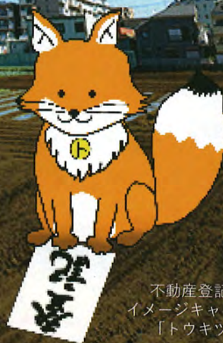
不動産登記推進 イメージキャラクター 「トウキツネ」

正当な理由 がなく相続登 記の申請をしな い場合、10万円 以下の過料が科され ることがあります。