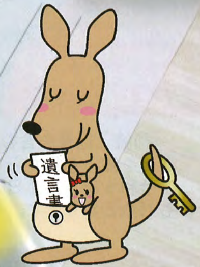
遺言書ほかんガルー