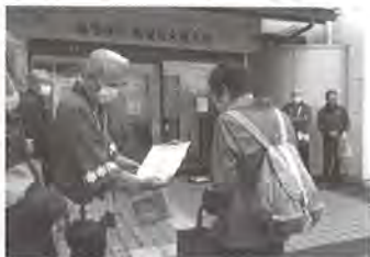
佐賀銀行佐賀医大前支店