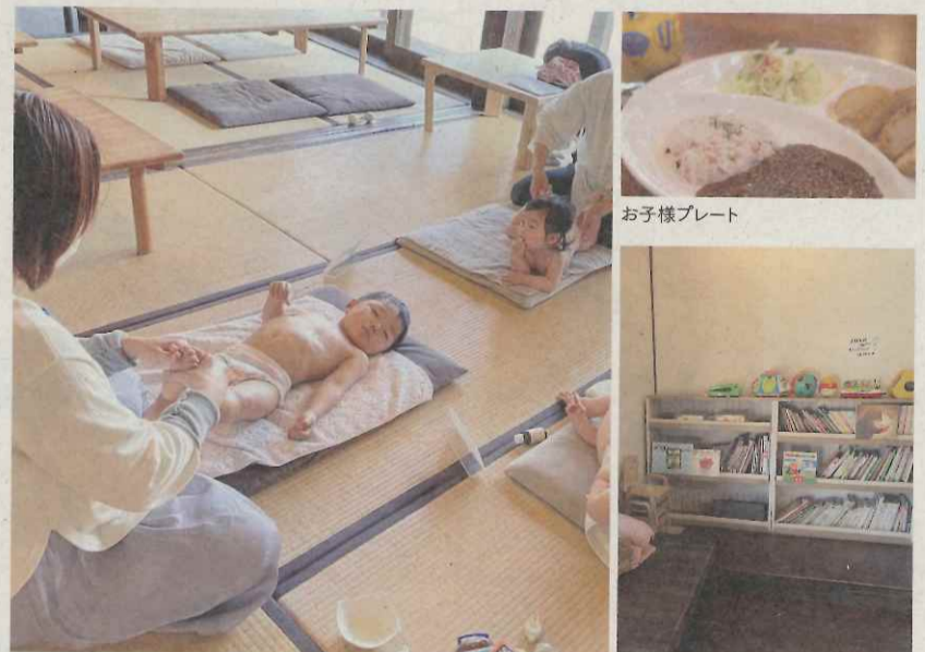
ベビーマッサージ教室の一角

ものづくりカフェ こねくり家 ☎0952-37-6905 ●佐賀市柳町4-16(旧久富家住宅) ●営業時間/平日11:30~15:00、土・日曜、祝日11:30~17:00 ※ランチメニューは14:30ラストオーダー ●定休日/月曜・毎月最終火曜 ●駐車場/あり(佐賀市歴史民俗館駐車場) ●Instagram @conekuriya