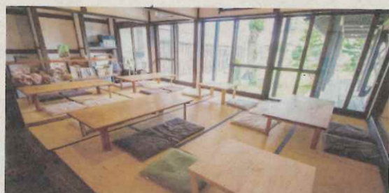
座敷スペースは特に週末は人気!事前予約がおすすめ