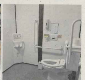
ベビーチェアやおむつ用のゴミ箱もあり