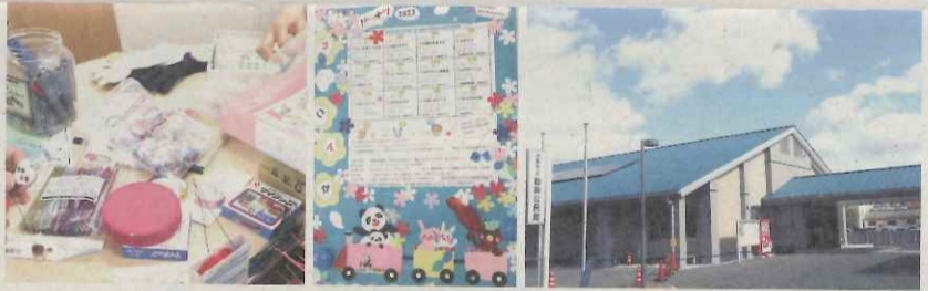
スタッフさんが心をこめながら手づくりのおもちゃや飾りを準備