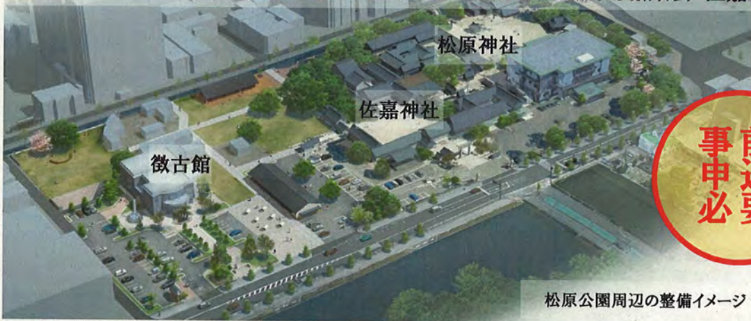
松原公園周辺の整備イメージ