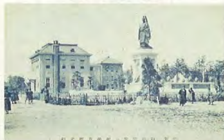
佐賀図書館と直正公銅像 大正2~5年頃撮影 絵葉書